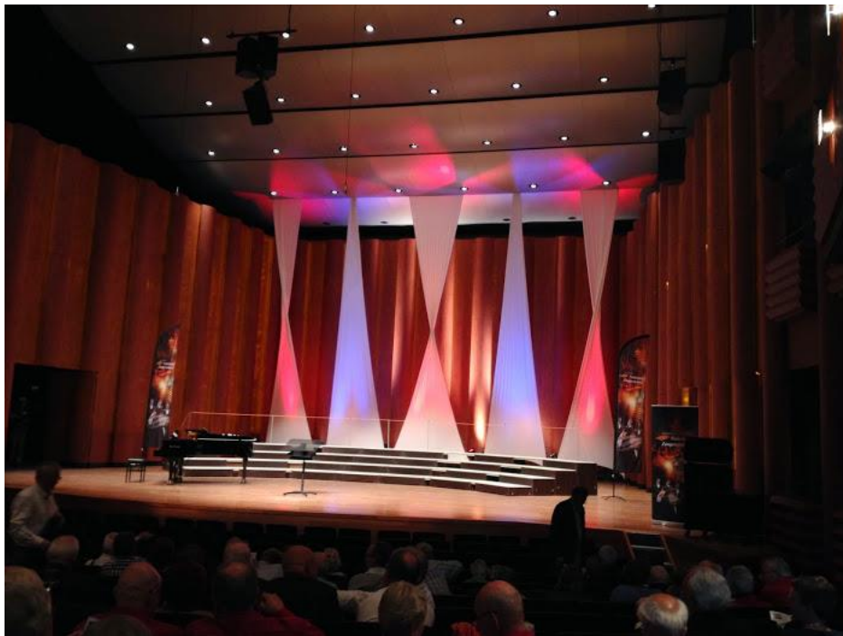
Figuur 8: Het lege Zwolse podium vlak voor het GVE-optreden

“Staan jullie altegaar met je lijfelijke asem klaar, mannen?”, zo schijnt hij woordeloos te zeggen! Ernst knippert iedereen toe met zijn ogen (zou ook moeilijk anders kunnen) en laat zijn armen dalen. Na de daling op het hoogste punt van de klim beland beginnen we simultaan, sereen en zacht Seigneure klanken de zaal in te slingeren. Het timbre, de sfeer voelt goed. De tonen, het ritme, de expressie en de dictie komen naar mijn bescheiden waarneming best aardig overeen met de bedoelingen van de franse componist. Het klinkt “comme il faut” om het maar eens kort en bondig samen te vatten. Ernst oogt tevreden en de zaal reageert idem dito met haar klappers.