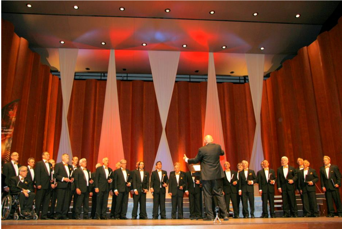
Figuur 9: Het Vocaal bezig met een van haar kernactiviteiten