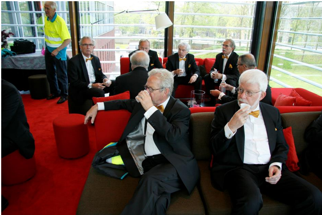
Figuur 5: Enkelen kunnen direct na aankomst “den inwendige mensch” maar niet vergeten

is zo pietluttig, dat het alleen met mijn handbagage al proppen geplazen zou zijn. Bovendien is er wat met het slot, maar met wat ambtelijk en vocaals gesleutel wordt dit euvel snel opgelost.