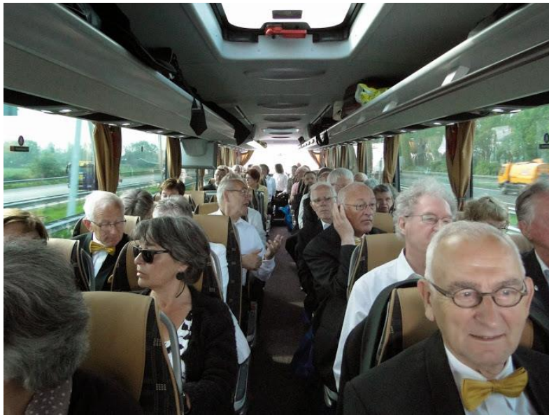
Figuur 4: Het voorste deel van de bus-inhoud op heenreis

Tegen 9.30 uur is de bus d'r eindelijk en vertrekken we richting Zwolle. Wat heet: in Beuningen slaan we al van de snelweg af om "Dees" (zonder gene) af te halen, zoals afgesproken aldus onze eigen Mao links vooraan in de bus. Wij wisten weer van niks. Onze ijverige schatbewaarder komt langs om € 5 van elke verstekeling te incasseren. Om 10.45 uur bij theater De Spiegel aangekomen (een kwartier gewonnen op het tijdschema van Tjeu) wil Rien zijn kunstje vertonen door ons pal voor de deur af te zetten. Dat lukt net niet ondanks gemillimeter langs paaltjes en geschuif met terrasmeubilair. Had ook niks gebaat want verderop belemmeren "bestelwagens" de beoogde ommevang. Vervolgens worden na enig dralen mannen (zangers) en vrouwen (fans) van elkaar gescheiden. Artiesten moeten via de artiesteningang. Onze collectieve geliefden worden als gewone bezoekers aangemerkt en horen bijgevolg de hoofdingang te nemen.