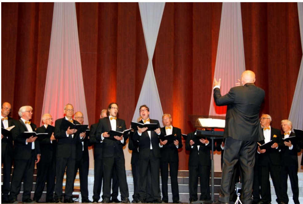
Figuur 10: Zicht op twee dartele lammetjes met daarachter schaapjes en daarvoor de ram

Bij het olijke en vrolijke heen en weer springende Lambscapes kan Oksana zich eindelijk wat meer uitleven op de kostbare vleugel. De zangmappen blijven nog steeds dicht. 6 Dit moeten we wél uit ons hoofd kunnen zingen. Op aangeven van Ernst slaat Oksana enkele tonen aan. Dan bezingen we gelijk contemplatieve monniken in een donkere kapel het Gregoriaanse lammetje van Maria. De eerste vier lammetjes huppelen gelukkig over de dam heen. Bij het vijfde “agnellum” blijft de menigmaal gemaakte fout (geen gelijke toon) gelukkig achterwege. Prima gedaan mijne heren.