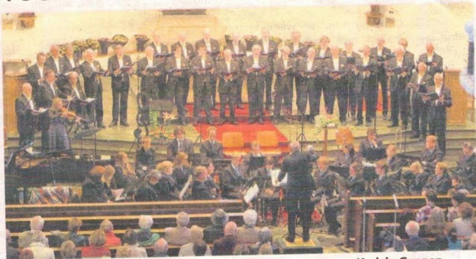
Het Genneps Vocaal schitterde onlangs nog in de Protestantse Kerk in Gennep.