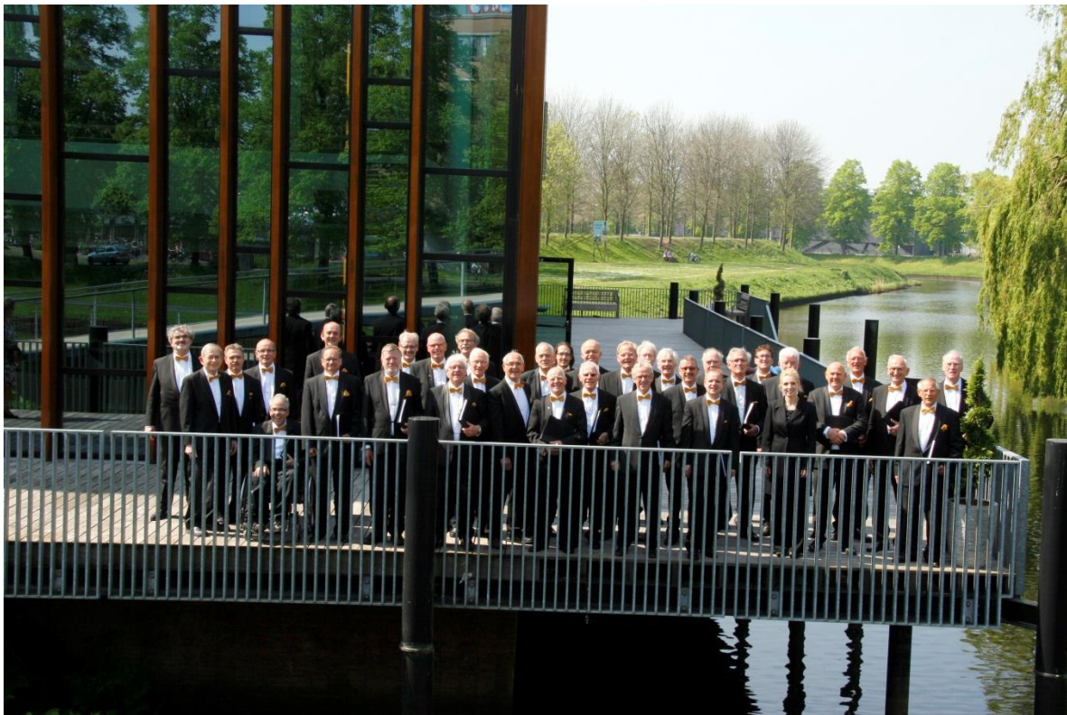
Figuur 12: Staatsiefoto van het GVE als aanstaand vice-kampioen van Nederland