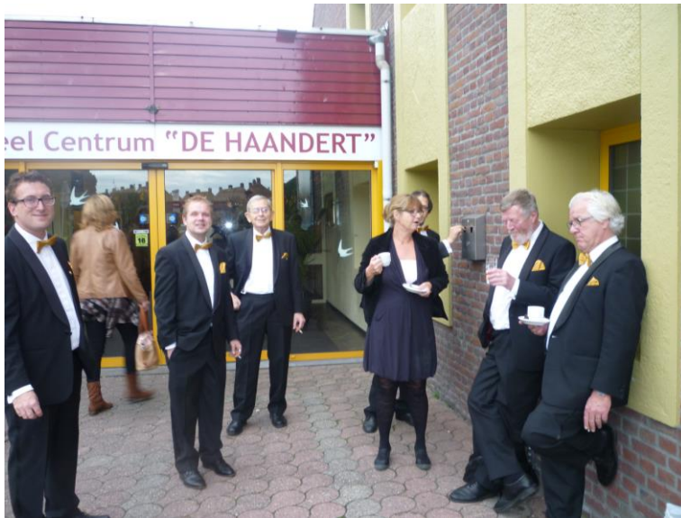
Figuur 2: Deel van "Het Vocaal" wacht Limburgse uitslag buiten af (anoniem)

In de B-klasse haalde "het Vocaal" de eerste plaats met 444 van de maximaal 500 te behalen punten: in rapportcijfers een 8,9. De resterende concurrentie kwam hier op zondag 27 oktober niet boven uit. Een prestatie van formaat om zich het beste mannenkoor van Limburg in de B-categorie te mogen noemen. Dus kan 'het Vocaal' zich opmaken om Limburg te vertegenwoordigen op de finale in Zwolle. Voor de rest volsta ik met verwijzingen naar: