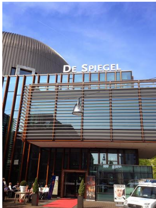
Figuur 7: De succesarena van het Vocaal: theater De Spiegel

Om 12.15 uur moeten we in een van de spelonken onderin De Spiegel inzingen. Louis gaat als verantwoordelijke voor de outfit bij menigeen aan de strik hangen en sommige pouchetjes herschikken. Daarna stellen we ons doodstil op in het voorgeborgte. Dat gaat niet zonder slag of stoot, omdat sommigen nog steeds niet weten achter wie ze aan moeten huppelen. Maar met wat geduw en getrek van oplettende collegae komt ook dat toch in orde. Een "requisiteur" of theaterman leidt ons van het geborgte naar het podium. Ik sta paf: de ruimtes achter de imposant hoge coulissen alleen al zijn groter dan het Pica Mare-podium. De theatergerant gebiedt ons stil te zijn, zodra we in de donkere ruimte achter de coulissen komen en verbiedt ons op de houten vloer te lopen, beide vanwege verstorende effecten op de lopende uitvoering.