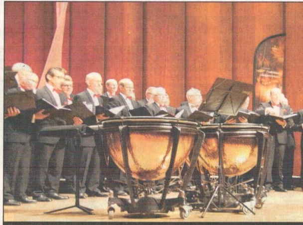
Trevedenheid. Het Boxmeers Vocaal Ensemble gooide hoge ogen en reikte op het Nationaal Mannenkoren Concours in Zwolle tot een tweede plaats in de A-categorie.